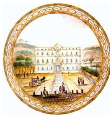
Palazzo nobiliare a Portici. Dalla raccolta di porcellane di Capodimonte

On y voit un fortin qui fut construit pour l'instruction de Ferdinand I dans ses premières années. On en a fait présentement une ménagerie, où l'on conserve de rares animaux.