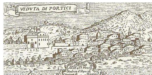
Stampa della città di Portici vista dal mare in una stampa da La Napoli città nobilissima di Domenico Antonio Parrino.

Behind this wilderness, higher up on the mountain, stands a most delightful villa, belonging to Sir VWilliam Hamilton, the English ambassador. From a balcony in front of this house was the present view taken: it commands a prospect of the whole of the city and bay of Naples, which is justly considered as one of the most interesting and beautiful scenes in the world. On the left the bay is bounded by the lofty promontory of Surrentum, in the centre is situated the romantic island of Caprea, and the right is terminated by the classic shores of Baia, Procita, and Ischia.