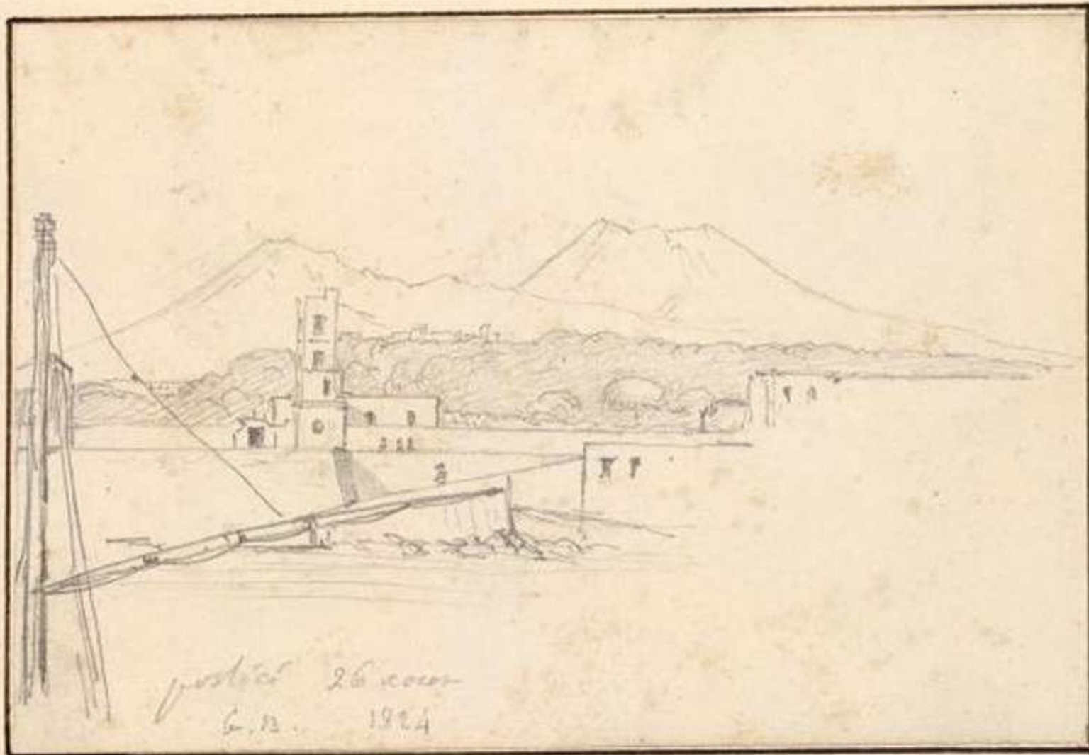
Portici 1824 (INHA- Institut national d'histoire de l'art Francia)