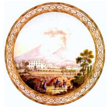
Portici, la campagna delle Delizie e il Vesuvio

This superb palace was built by Charles III in 1738, from the designs of Anthony Cannevari. Its situation is the most beautiful that can be imagined. The principal front overlooks the sea, and commands a most magnificent view of the Gulf of Sorrento; the Island of Capri, the summit of Pausilipo, the Island of Procida and the whole of the Gulf of Naples. The great court, which is in the form of an octagon, is crossed by the public road leading to the provinces of Salerno, Basilicata, and Calabria. On two sides of this court are the royal apartments containing ancient mosaics, a room entirely paved and plastered with China, and a gallery which has been but lately formed, and where among other pictures may be seen the portraits of Joachim Murat and of his family. The palace has also delightful shady groves, and beautiful gardens, interspersed with basins and fountains. A collection of paintings found at Herculaneum, Pompeii and Stabia, consisting of 1577 pieces, are exhibited in 16 rooms of a casino belonging to the palace. This museum and the palace itself cannot be seen without an order from the Lord High Steward. The pictures were all painted on the walls of private houses, and public edifices; and according to the opinion of Winckelmann, not much more ancient than the Augustan age, at which period painting was in its wane. They offer however a rather strange combination; namely the beauty of the composition, and the PALAZZO REALE DI PORTICI.