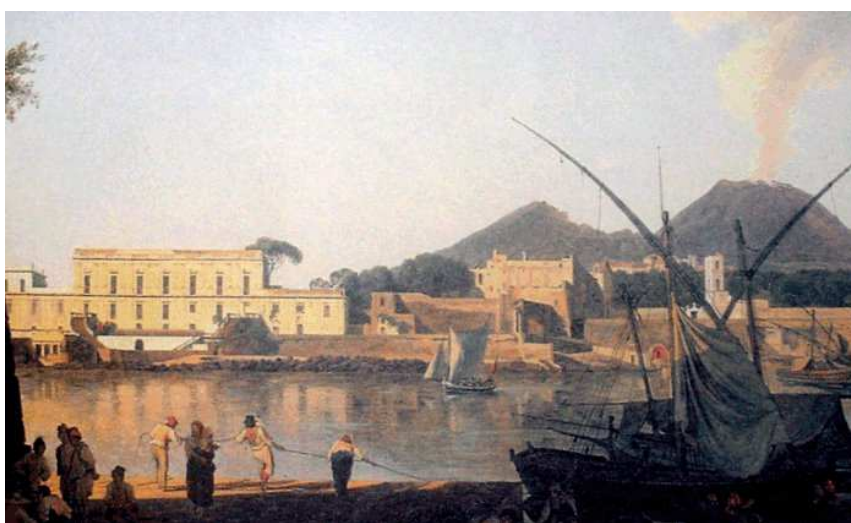
1 Di Lady Morgan (Sydney), Sir Thomas Charles Morgan. Italy, Volume 1-2. London 1821