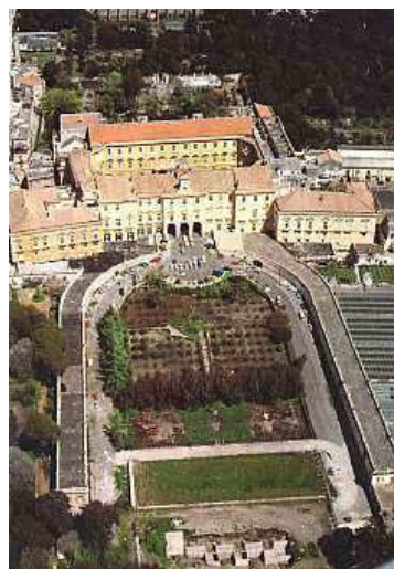
Palazzo Reale di Portici.

Sous le village de Portici et celui de Resina, se trouve ensevelie l'ancienne Ville d'Herculaneum.